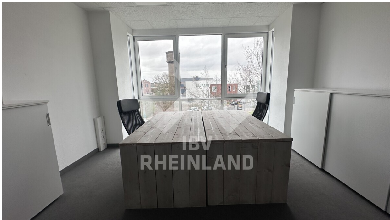
Büro 26 m 2