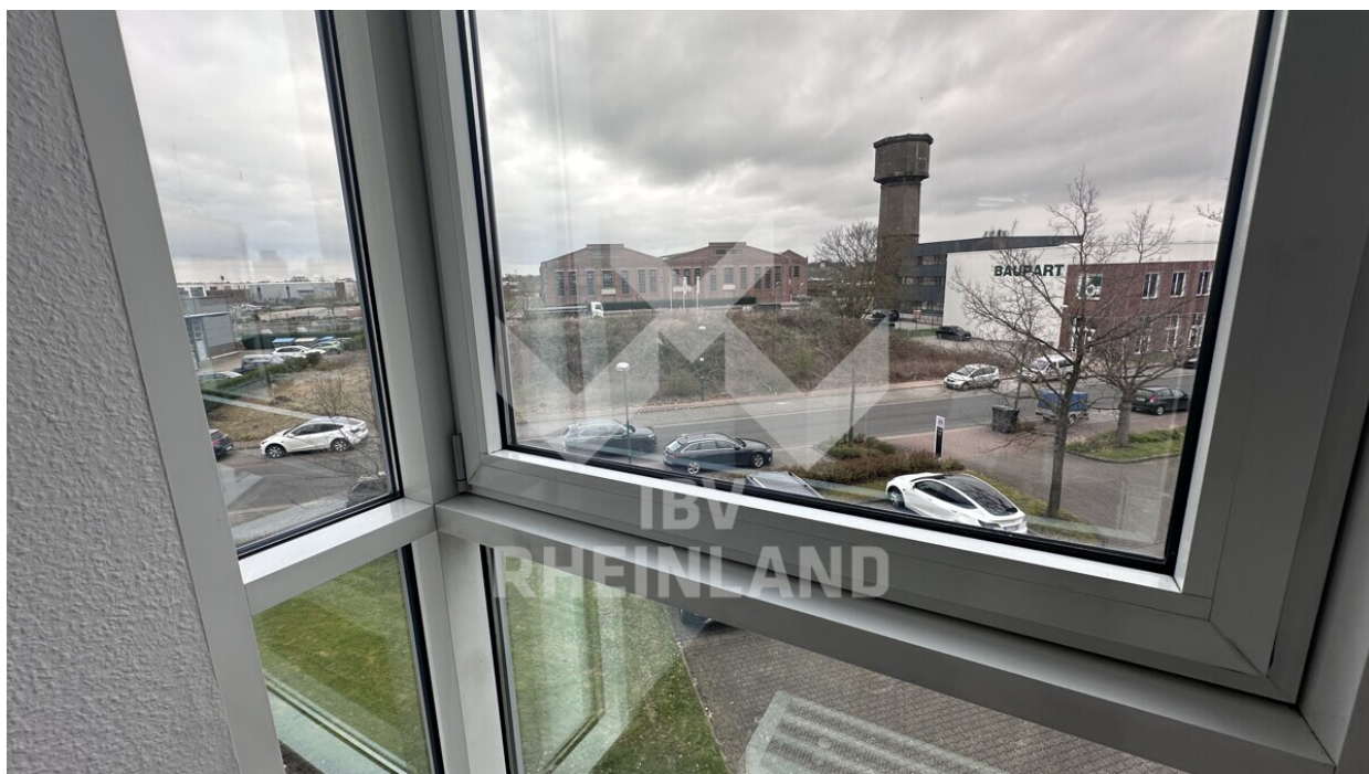
B Büro 26 m 2