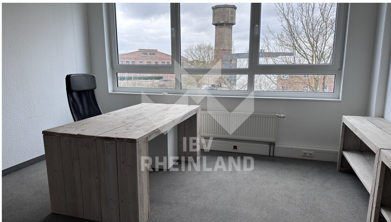
Büro 24 m 2