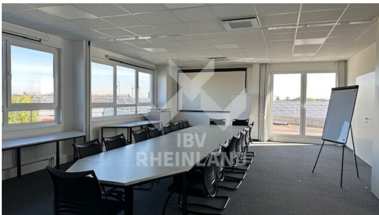
Konferenz III OG