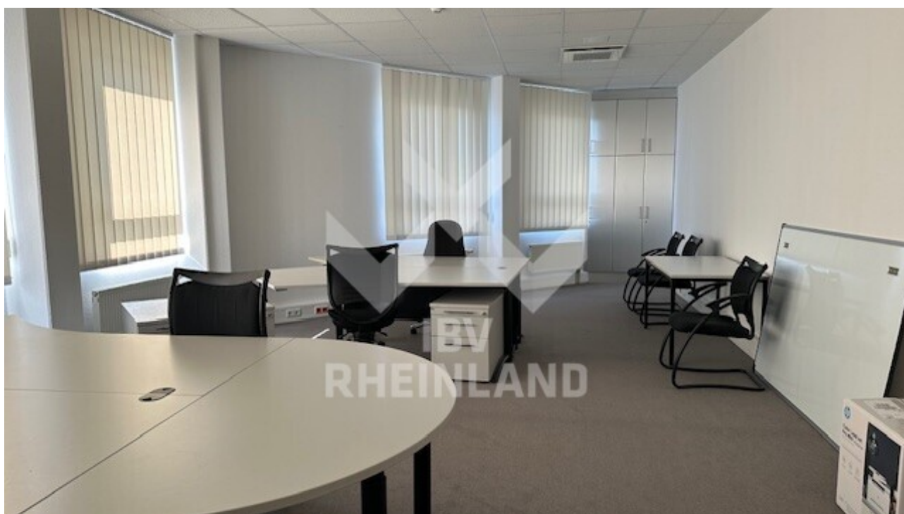
Büro 44 m 2