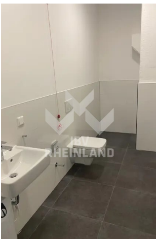
WC je D/H