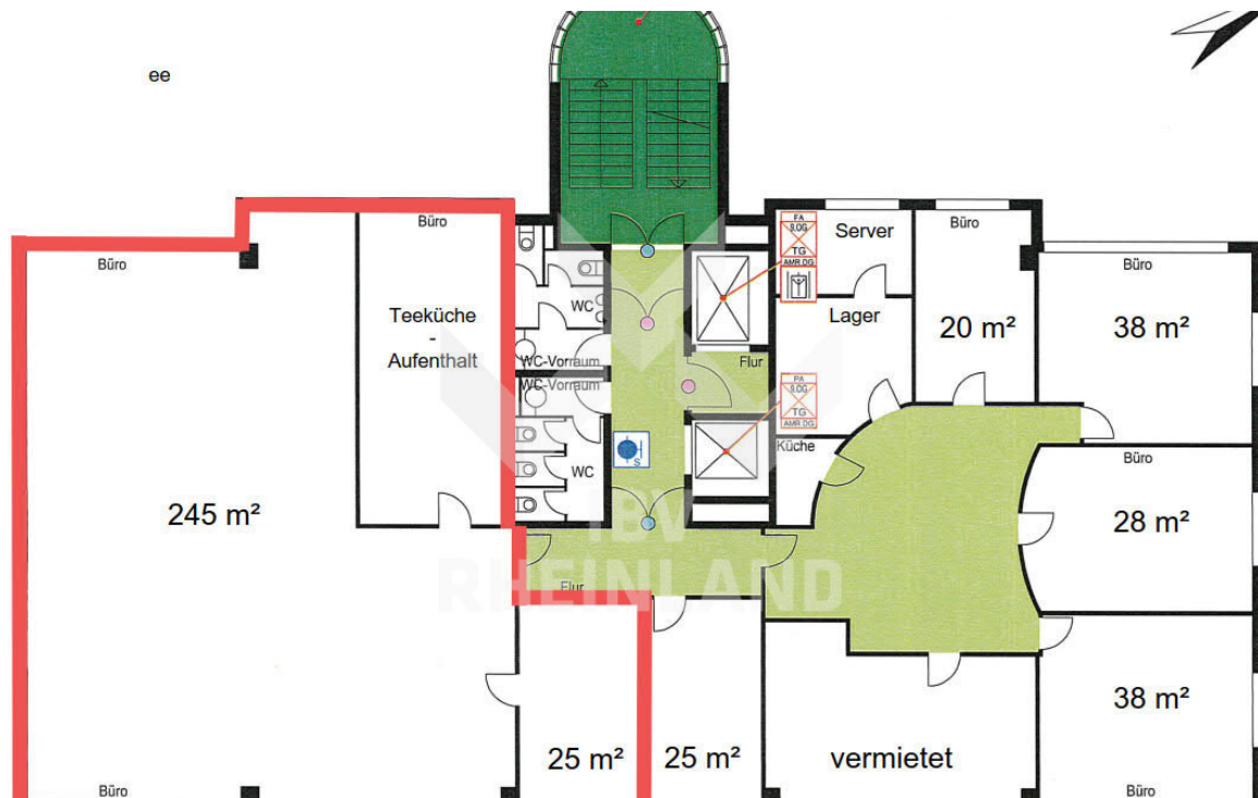
2. OG Grundriss (2)