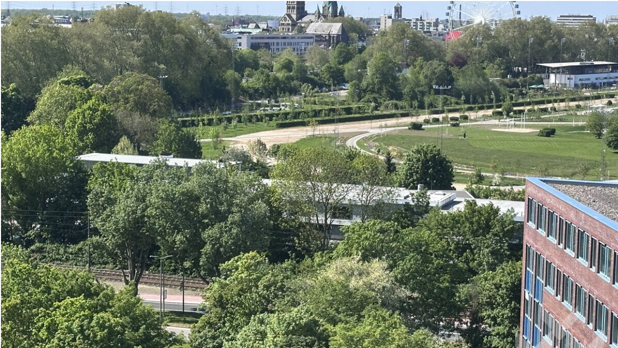
gg. und Blick LG