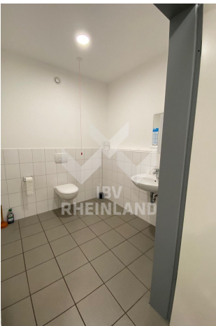
beh. WC in Einheit