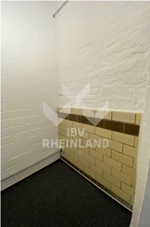
Lager mit Charme