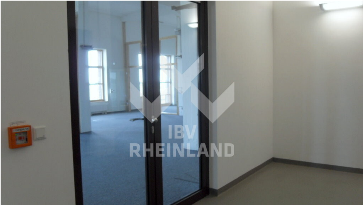
Modern im Altaub