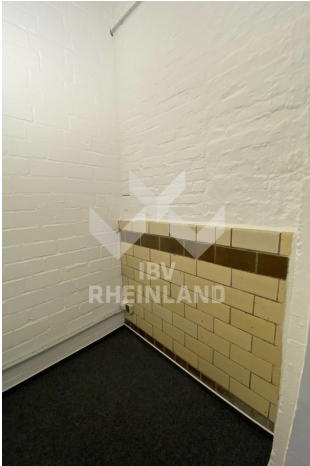
Lager mit Charme