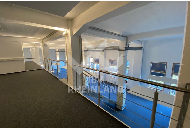
Empore - Meeting