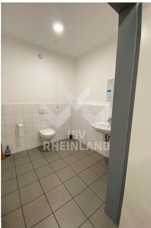
beh. WC in Einheit